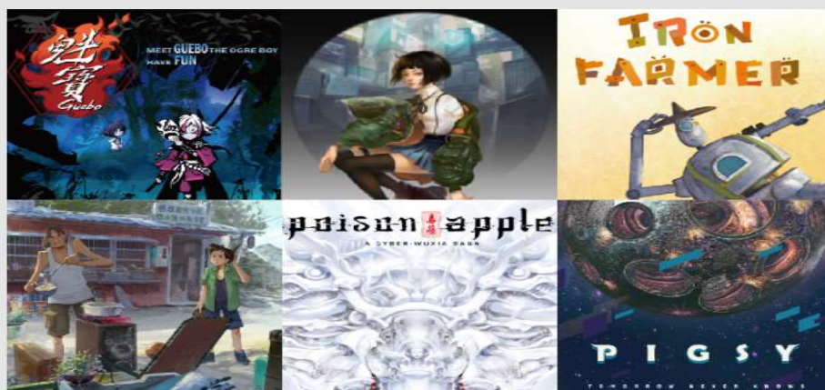
Partners Pitches 臺灣專場提案作品